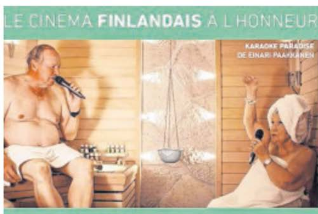
Basilic Diffusion multiplie les rendez-vous thématiques, à l'image de la soirée de ce samedi 2 mars, dédiée au cinéma finlandais.

Un large choix dans les films Avec 800 adhérents et plus de 70 bénévoles impliqués dans son fonctionnement, l'association reconnue d'intérêt général et labellisée Espace de vie sociale par la CAF de Vaucluse, assure la gestion totale du cinéma Le Cigalon, classé Cinéma art et essai, et du cinéma itinérant La Tournée du Cigalon. De ce fait, elle propose une programmation cinématographique pour un large public, partage des relations avec le monde associatif, culturel, éducatif et social du Sud Luberon, contribue à son animation et